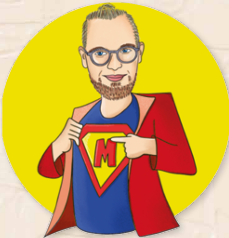
Autor: Ewelina Protasiewicz

📌 Scenariusz i wykonanie: Miłosz Konarski – nauczyciel rytmiki w przedszkolach i żłobkach, kompozytor, aranżer, instrumentalista. Dzieciom w całej Polsce znany jako Pan Miłosz.